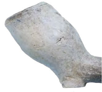
Afb. 29a-b. Hielmerk DA met stippen boven en onder de letters. Circa 1650-1660, Gouda?