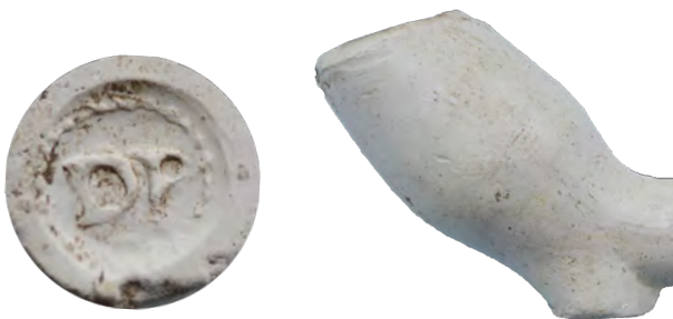
Afb. 37a-b. Hielmerk DP gekroond. Circa 1640-1680, Breda?