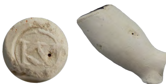
Afb. 81a-b. Hielmerk KV. Circa 1650-1670.