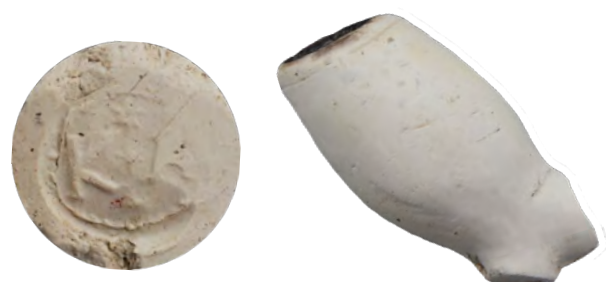
Afb. 79a-b. Hielmerk KA met drie sterren tussen de letters. Circa 1640-1670.