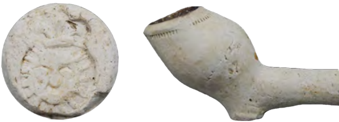
Afb. 74a-b. Hielmerk zon gekroond. Circa 1630-1650.