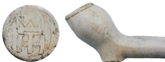
Afb. 11a-b. Monogram van letters H en H. Circa 1610-1630.