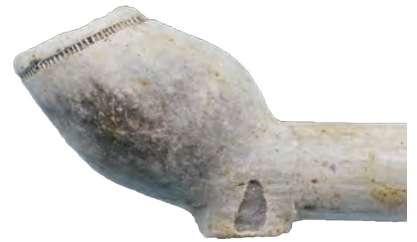
Afb. 25a-b. Hielmerk DA gekroond. Gouda/Gorinchem?! Circa 1640-1660.