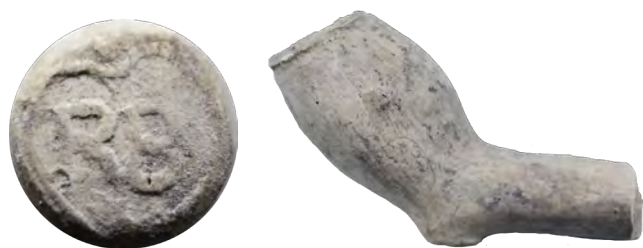
Afb. 8a-b. Hielmerk RB in hartvormig kader boven een ster. Circa 1610-1630.