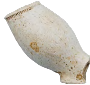
Afb. 54a-b. Hielmerk M W gekroond. Circa 1640-1660.