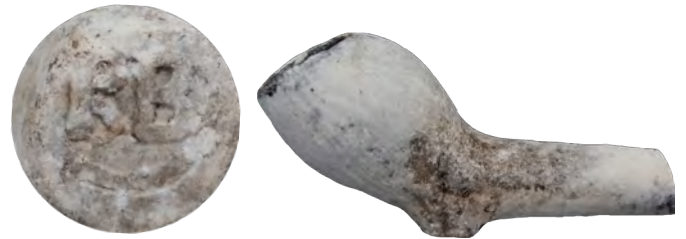
Afb. 73a-b. Hielmerk RB. Circa 1620-1630.