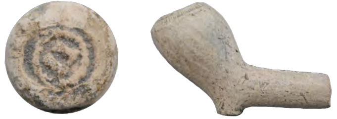
Afb. 71a-b. Hielmerk II. Circa 1610-1630.