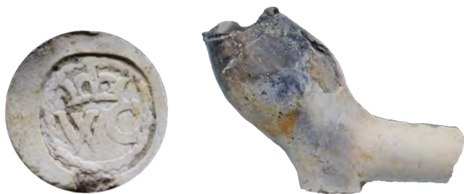
Afb. 60a-b. Hielmerk WC gekroond. Circa 1620-1640.