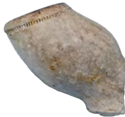
Afb. 24a-b. Hielmerk DA met ster boven en onder de letters. Circa 1630-1650, Gouda?