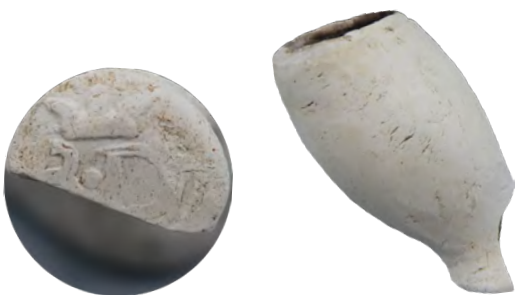
Afb. 84a-b. Hielmerk RD gekroond met stip tussen de letters. Circa 1640-1660.