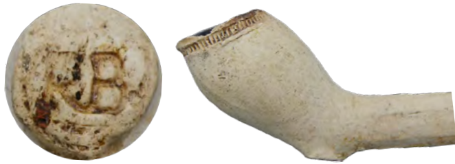
Afb. 72a-b. Hielmerk RB (intaglio gestempeld). Circa 1620-1630.