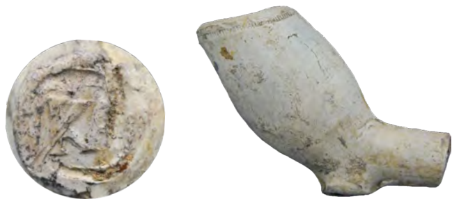
Afb. 80a-b. Hielmerk KA. Circa 1640-1670.