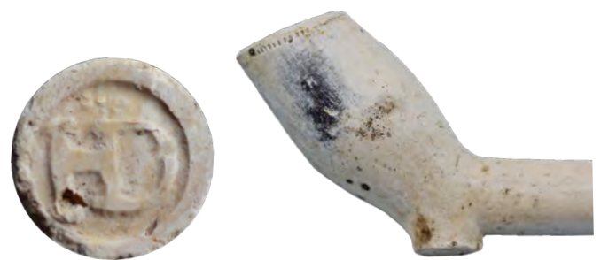
Afb. 40a-b. Hielmerk HD monogram. Circa 1650-1670.