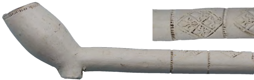
Afb. 55a-c. Hielmerk P C met sterren. Circa 1650-1670.