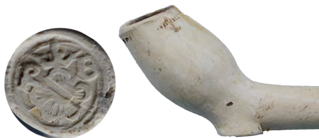
Afb. 9a-b. Hielmerk RB aan weerszijden van een gekroonde roos, circa 1640-1660.