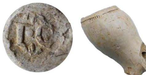
Afb. 5a-b. Hielmerk IC met stip tussen letters en lelies of bladeren boven en onder de letters. Circa 1610-1630.