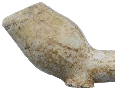
Afb. 51a-b. Hielmerk I K met stippen tussen de letters I en aan weerszijden van de letter K. Circa 1660-1680.