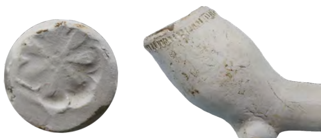
Afb. 67a-b. Hielmerk bloem. Circa 1640-1660.