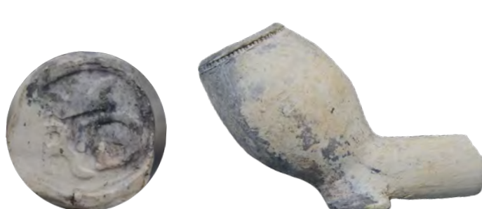
Afb. 83a-b. Hielmerk RD gekroond met stip tussen de letters. Circa 1640-1660.