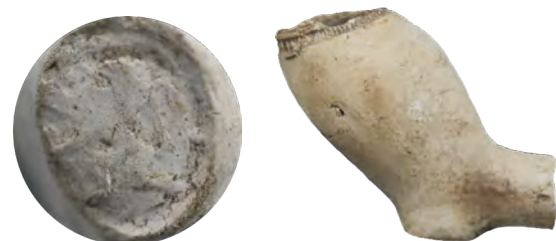
Afb. 68a-b. Hielmerk staande leeuw. Circa 1610-1630.