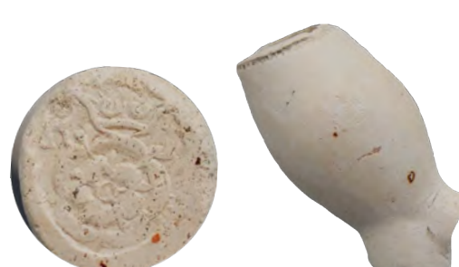
Afb. 85a-b. Hielmerk RI (of RJ) aan weerszijden van een gekroonde roos. Circa 1640-1660.