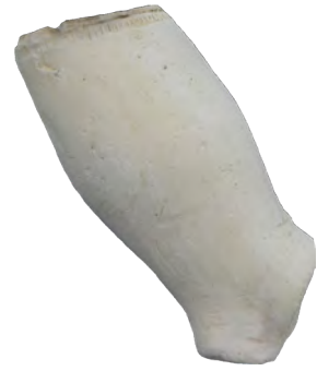
Afb. 52a-b. Hielmerk L S. Circa 1650-1670, Gouda?