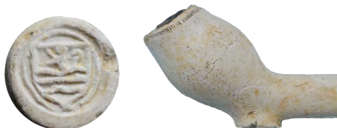
Afb. 12a-b. Wapen van Zeeland. Circa 1620-1640.