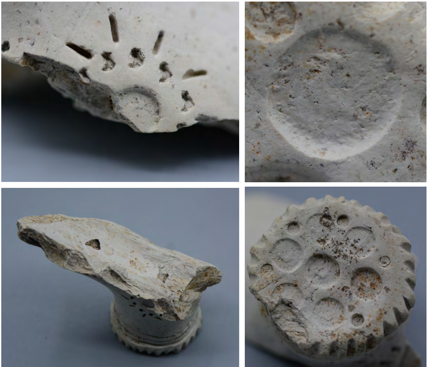
Afb. 2a-d. Verschillende aangezichten van het hielfragment van de presentatiepijp uit Middelburg. Collectie Hans Bostelaar.

bekende plaatsen als Gouda en Gorinchem.