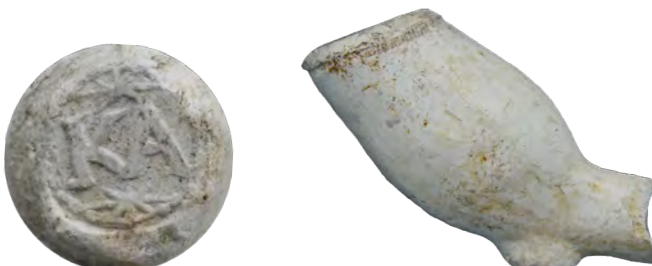
Afb. 78a-b. Hielmerk KA met ster boven en onder de letters. Circa 1650-1670, Gorinchem?