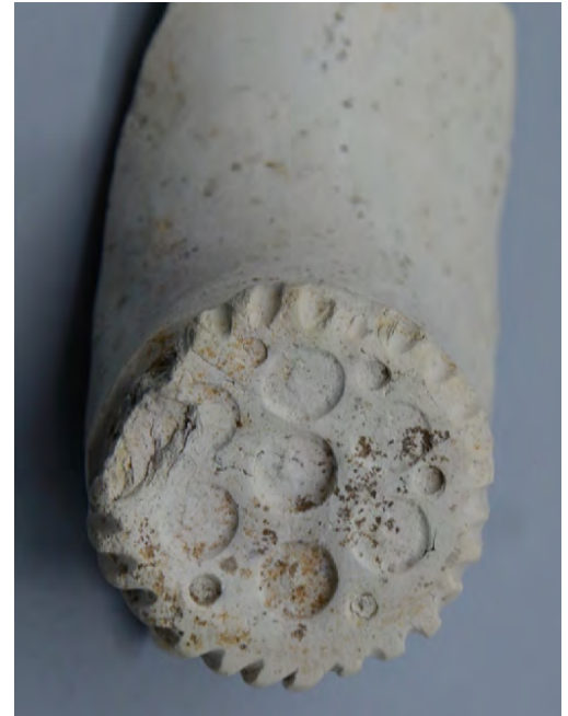
Afb. 1a-b. Zij- en onderaanzicht van het hielfragment van de presentatiepijp uit de omgeving van Middelburg. Collectie Hans Bostelaar.