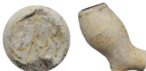
Afb. 69a-b. Hielmerk staande leeuw. Circa 1610-1630.