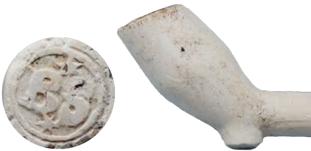
Afb. 18a-b. Hielmerk BS met een ster boven en onder de letters. Circa 1670-1690.