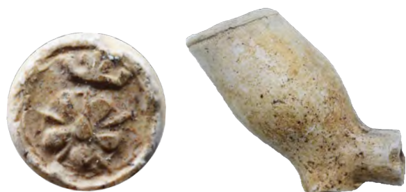
Afb. 64a-b. Hielmerk roos gekroond. Circa 1650-1670.