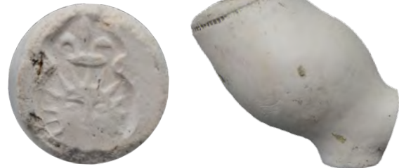
Afb. 75a-b. Hielmerk zon gekroond. Circa 1630-1650.