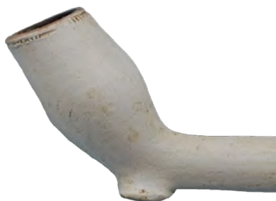
Afb. 56a-b. Hielmerk R G aan weerszijden van een gekroonde roos. Circa 1640-1660.