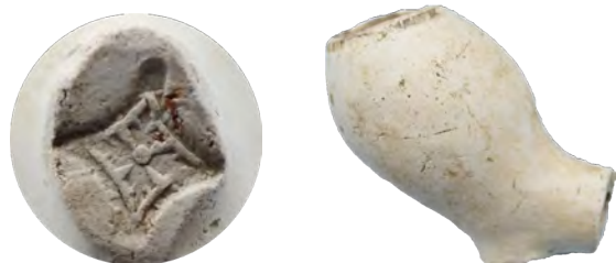
Afb. 10a-b. Ruitvormig stempel. Circa 1610-1630.