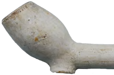
Afb. 53a-b. Hielmerk M I gekroond. Circa 1640-1660, Delft?