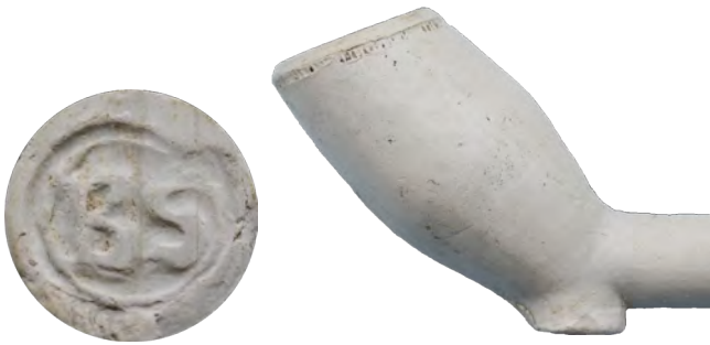
Afb. 16a-b. Hielmerk BS. Circa 1670-1690.