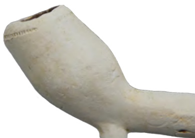
Afb. 58a-b. Hielmerk S S. Circa 1650-1670.