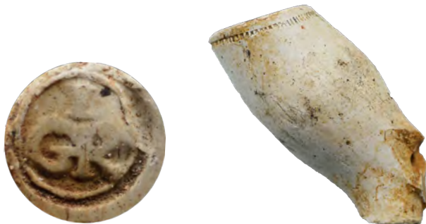
Afb. 39a-b. Hielmerk GIR. Circa 1650-1670, Gouda?