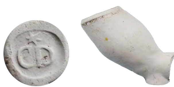
Afb. 23a-b. Hielmerk CD, met ster boven de de letters. Circa 1650-1670. Gouda/Breda ?!