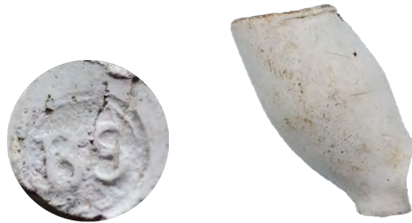
Afb. 17a-b. Hielmerk BS met stip tussen de letters. Circa 1670-1690.