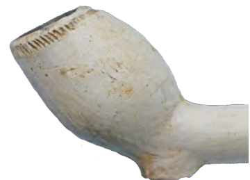
Afb. 59a-b. Hielmerk T T gekroond. Circa 1640-1660.