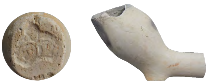
Afb. 86a-b. Hielmerk TE onder een boom of staande lelie. Circa 1640-1660.