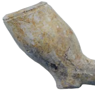
Afb. 28a-b. Hielmerk DA met stippen boven en onder de letters. Circa 1650-1660, Gouda?