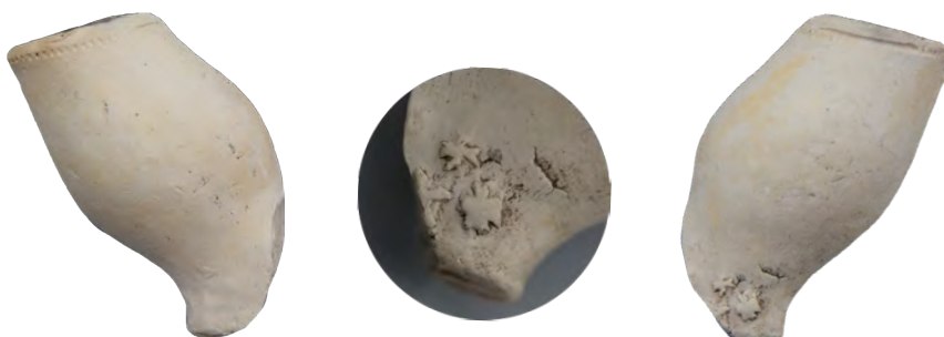
Afb. 87a-c. Ongemerkt pijp met aan rechterzijde van de hiel een drietal sterren. Circa 1640-1660.