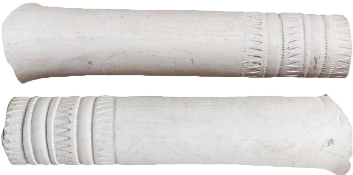
Afb. 3a-b. Linker- en rechterzijde van het steelfragment van een presentatiepijp uit Middelburg. Lengte circa 12,5 cm, diameter ca. 1,8 cm.

Het merk RB komt in een aantal varianten (afb. 7-9)