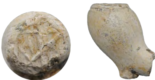
Afb. 76a-b. Hielmerk huismerk of monogram van verschillende letters. Circa 1610-1630.