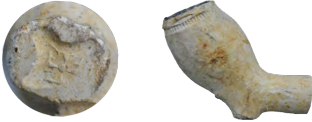
Afb. 70a-b. Hielmerk ruit met patroon. Circa 1610-1630.