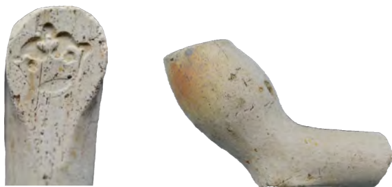
Afb. 4a-b. Hielmerk kroon. Circa 1600-1620.