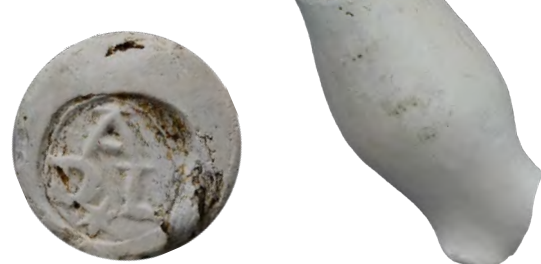
Afb. 77a-b. Hielmerk DAL boven ster. Circa 1640-1660.