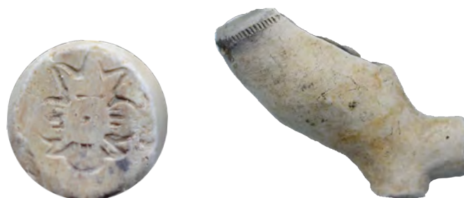
Afb. 65a-b. Hielmerk roos gekroond. Circa 1640-1660.