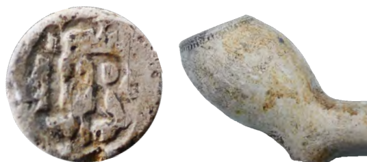
Afb. 6a-b. Hielmerk IR. Circa 1610-1630.