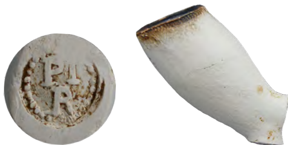
Afb. 82a-b. Hielmerk PIR. Circa 1650-1670.