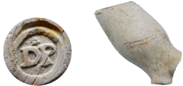
Afb. 36a-b. Hielmerk DP met een ster boven en onder de letters. Circa 1640-1680. Breda?