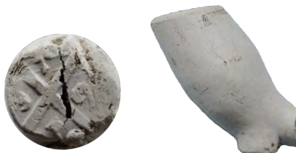
Afb. 63a-b. Hielmerk met kruis en franse lelies in de vlakken. Circa 1650-1670.