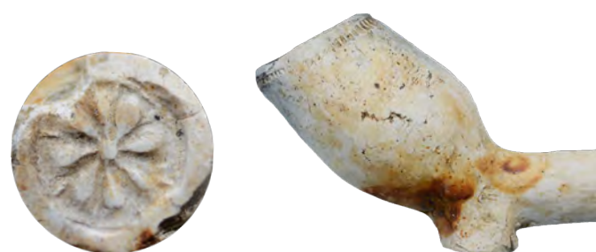
Afb. 66a-b. Hielmerk bloem. Circa 1640-1660.