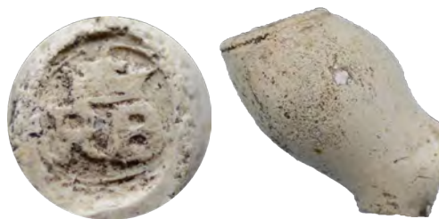
Afb. 7a-b. Hielmerk RB gekroond. Circa 1610-1630.