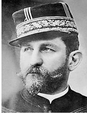
Afb. 4. Generaal Boulanger. 11

Boulanger werd geboren op 29 april 1837 en heeft onder Mac Mahon als generaal gediend. In 1871 maakten zij samen op bloedige wijze een einde aan