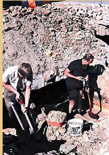
Hoogtepunt in een kelder. (pag. 71)