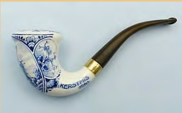
Zenith "vergane Goudse glorie". (pag. 73)