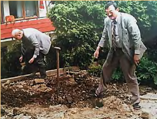
Eerste herinneringen aan de PKN en een bezoek aan Duitsland. (pag.66)