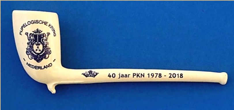
Weet u dat nog? (pag. 64)