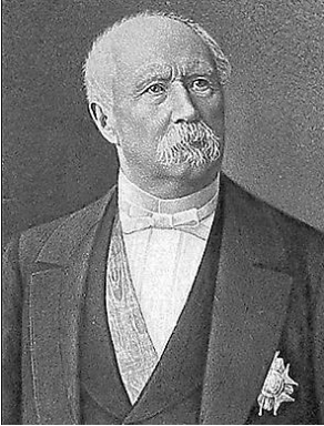
Afb. 3. Patrice de Mac Mahon. 10