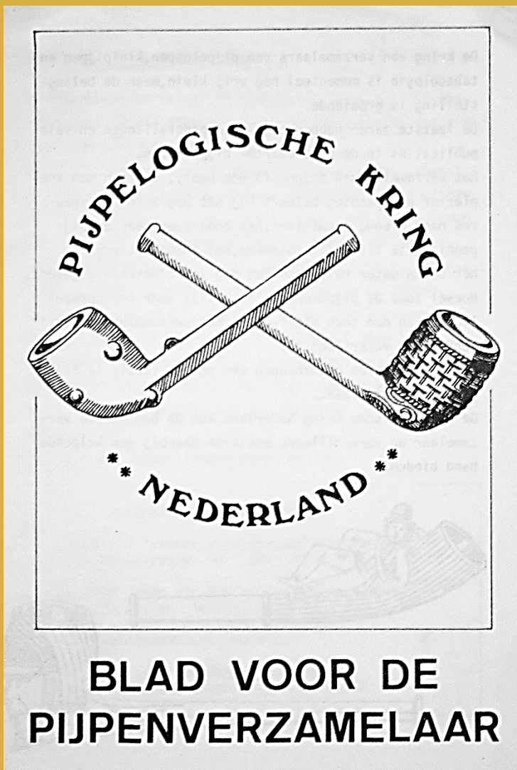
Wervingsfolder uit de beginperiode (1978) van de Pijpelogische Kring Nederland met daarop twee Westerwald pijpen.