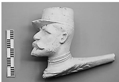
Afb. 2a-b. Pijp met nummer 130 uit de catalogus van P. van der Want, Gouda, ca 1910.

de tweede helft van de 19 e eeuw enorme hoeveelheden verschillende figurale pijpen werden geproduceerd. De op dat moment nog actieve Nederlandse fabrikanten boden in vergelijking hiermee een beperkt aanbod van figurale pijpen en de modellen waren meest niet zelf ontworpen: persvormen hiervoor werden vooral in het buitenland (België en Frankrijk) betrokken op het moment dat pijpenfabrikanten aldaar hun productie beëindigden of een specifiek model achterhaald was door actualiteit en bijvoorbeeld daarmee zijn waarde verloor. De bekendste voorbeelden van ‘geïmporteerde’ figurale vormen en modellen zijn te vinden in het assortiment van Goedewaagen, maar ook de firma’s Prince en Van der Want kochten (figurale) persvormen in het buitenland.