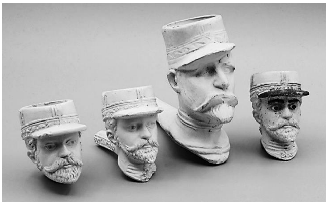
Afb. 6. Van links naar rechts, twee verschillende uitvoeringen (respectievelijk manchetsteel en vaste steel) van Gambier voorstellende 'General Boulanger'. Als derde de Van der Want pijp en geheel rechts dezelfde steelpijp van Gambier maar met emallering.

vanwege een gebrek aan actualiteitswaarde. Wat natuurlijk mogelijk is, is dat de vorm afkomstig is uit een faillissement uit deze periode. De optie dat de persvorm door Van der Want zelf gemaakt is met als doel een aansprekend export product te maken voor met name de Franse markt lijkt echter zeer aannemelijk. Dit laatste wordt mogelijk ook gestaafd door een tweetal andere opvallende aspecten van de pijp van Van der Want. De algehele uitvoering en gravering van de persvorm zijn duidelijk minder fijn en gedetailleerd dan wat we doorgaans bij Franse producten zien. Slijtage van de vorm lijkt in dit geval geen oorzaak van de duidelijk grove uitvoering. Daarnaast zijn ook de afmetingen opvallend. Zoals op afbeelding 6 duidelijk te zien, is de pijp ongewoon groot, met een hoogte van 10 cm is zij bijna twee keer zo groot als de meeste standaard modellen uit die tijd.