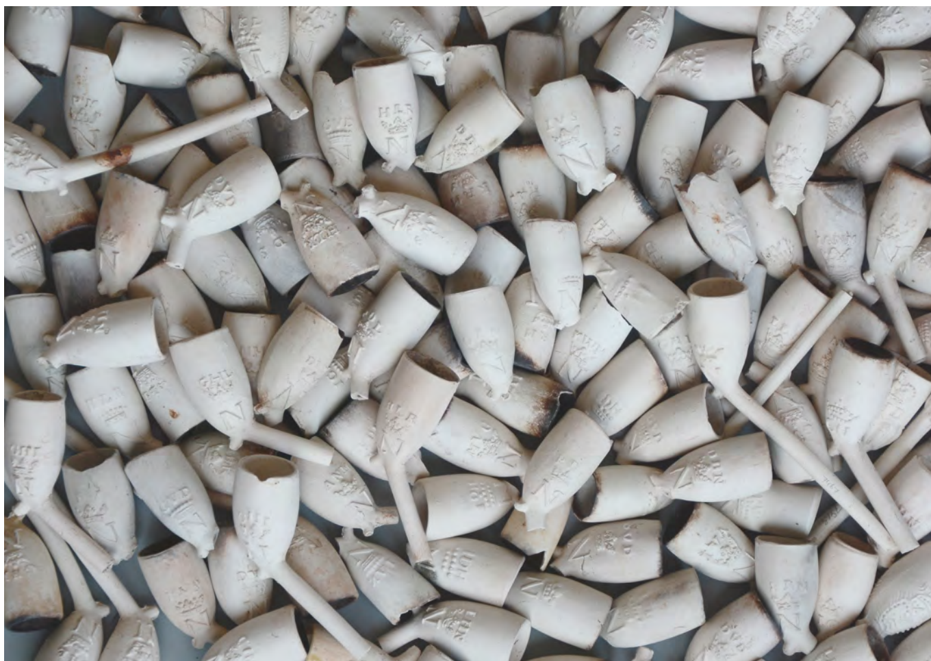
Afb. 16. Diverse uitvoeringen van de gekroonde N zoals die door verschillende pijpenmakers uit onder andere Schoonhoven, Gorinchem en Utrecht gemaakt zijn.

Voor meer informatie: www.tabakspijp.nl/schoonhoven