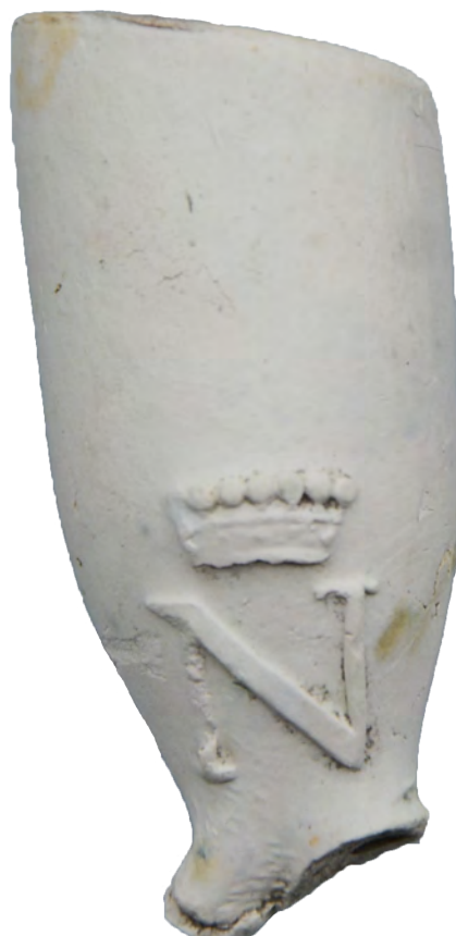
Afb. 1. Een van de oudste uitvoeringen van het ketelmerk N gekroond, tussen circa 1700 en 1720 in Schoonhoven gemaakt.

Over de Schoonhovense pijpennijverheid is in het verleden het een en ander gepubliceerd, waarbij al deze publicaties gemeen hebben dat ze zich vooral baseerden op een deel van het Schoonhovens archief dat de laatste decennia van de 18e eeuw beslaat. Naar de Schoonhovense pijpenmakers van voor die periode was nooit gericht onderzoek gedaan. Dit vormde het startpunt voor een uitgebreidere archiefstudie die recent gepubliceerd is. 1 Hierin wordt een geheel nieuw beeld geschetst van de tabakspijpennijverheid in het stadje, en is een catalogus opgenomen van ruim 120 verschillende pijpenmakers met veel foto's van hun producten. De helft van de hierin beschreven pijpenmakers was tot